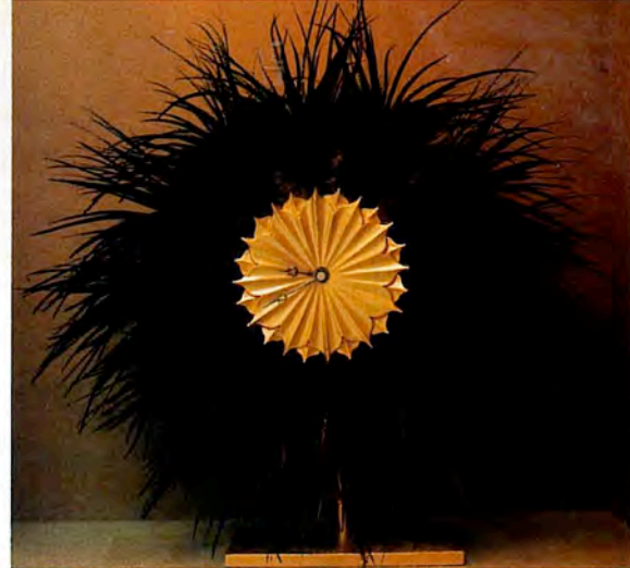
Reloj de plumas y aplicaciones en oro mate, creado por Gerard de Saint-Fort-Paillard. Galería Cour Interieur.