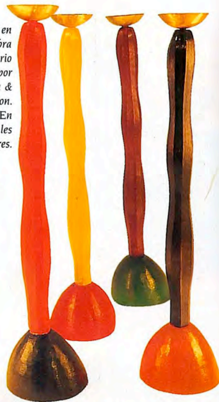
Candeleros en piedra y fibra de vidrio realizados por Migeon & Migeon. Galería En Attendant les Barbares.

A todos estos muebles los une el tedio hacia aquello que suene demasiado a "diseño", "neodiseño" o "antidiseño"