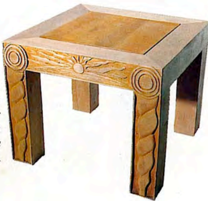
Mesa realizada en abedul y tintada, por Isabel y Elena Pan de Soraluze.