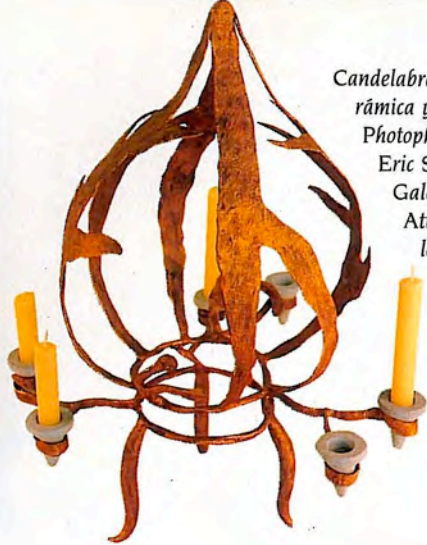
Candelabro de cerámica y metal, Photophore, de Eric Schmitt. Galería En Attendant les Barbares.